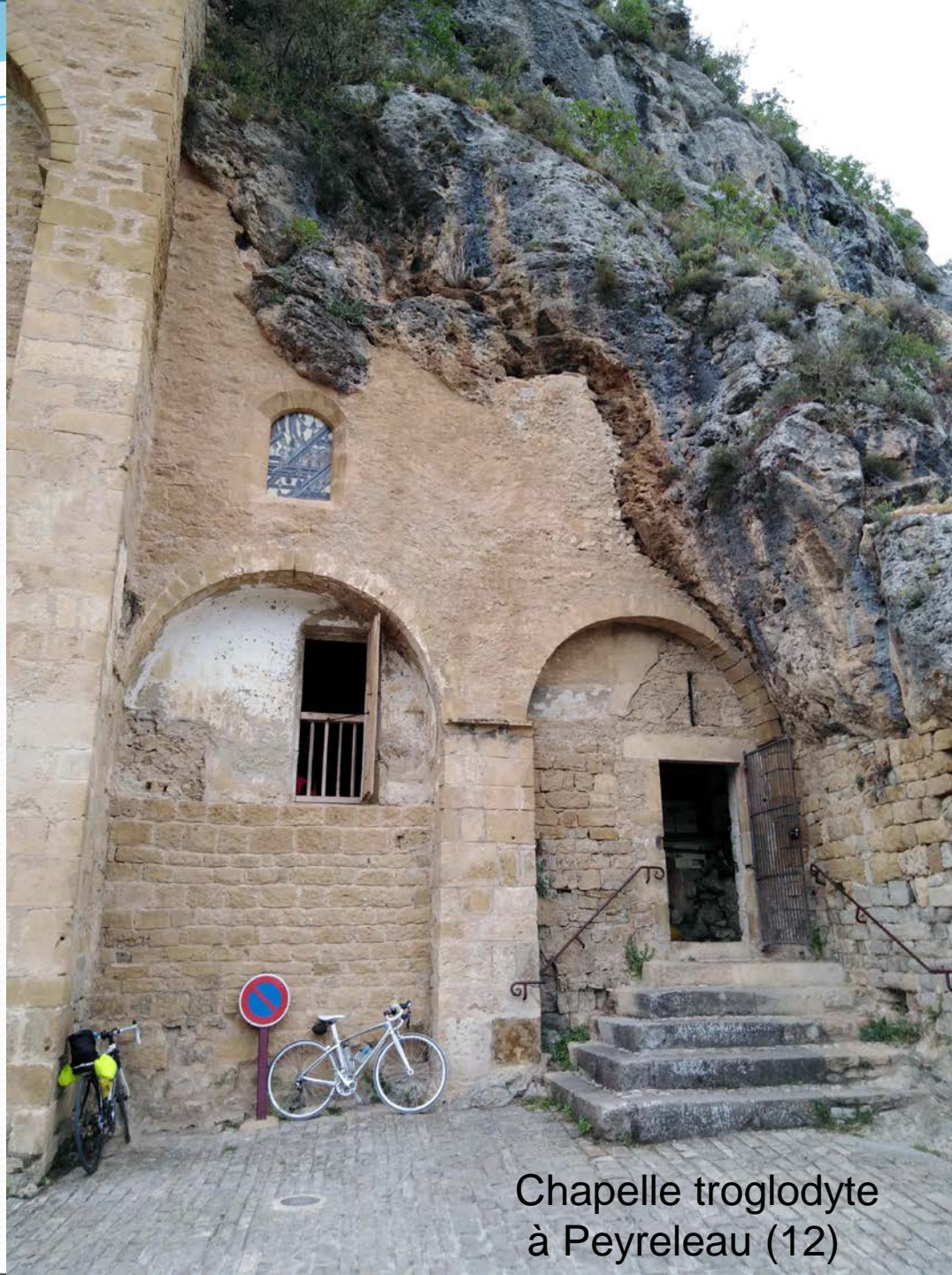
Chapelle troglodyte à Peyreleau (12)