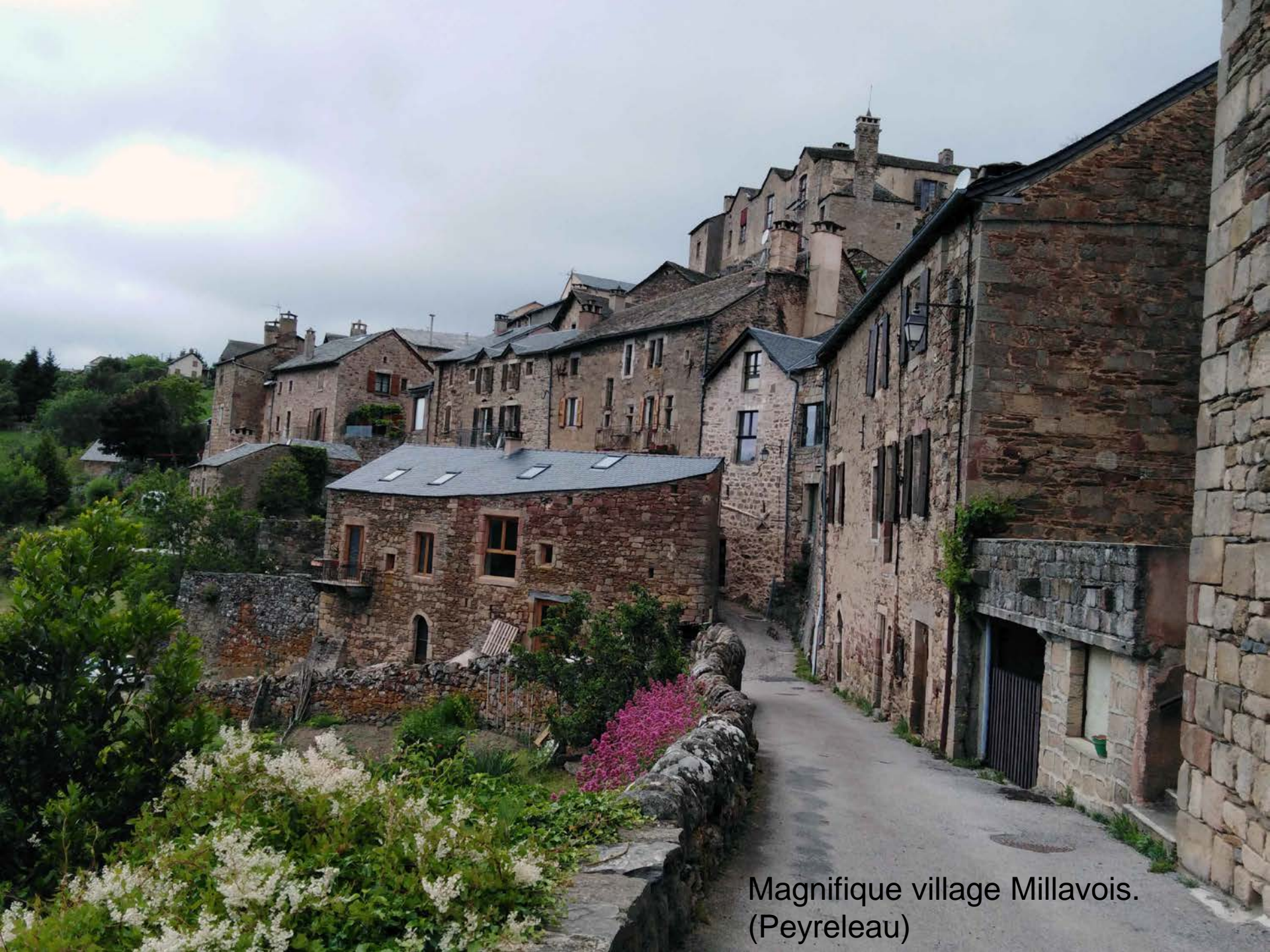
Magnifique village Millavois. (Peyreleau)